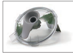
スクレーパーを回転(手動)させると処理物を掻き落とすことができます。