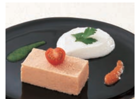
食材を個々に処理した後