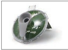
ブrikサーでほうれん草をペースト状にした直後